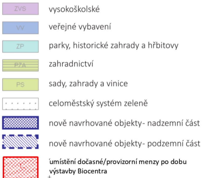
Obrázek 3 - Legenda k mapě územního plánu